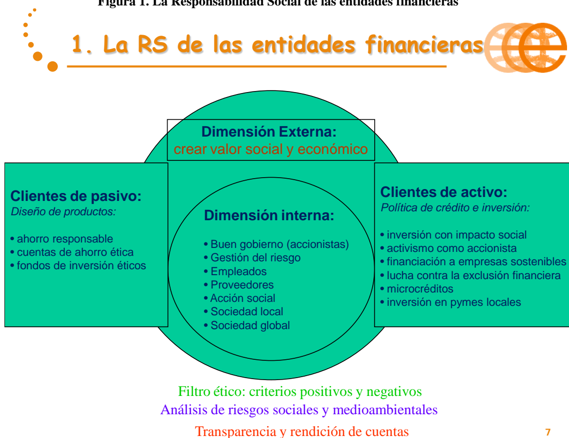
Figura 1. La Responsabilidad Social de las entidades financieras

La ética deberá estar presente en todas sus políticas y estrategias de activo, pasivo y de remuneración a ejecutivos.. En la Figura 1 se muestra el esquema donde se reflejan los diferentes aspectos de la Responsabilidad Social de las entidades financieras